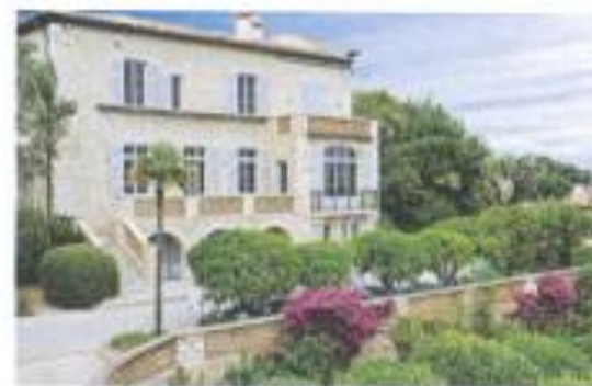
Domaine des Colettes, hvor Renoir boede med sin kone og to børn, fungerer i dag som et ganske vidunderligt museum.

Ikke alene er der flere gallerier i midaldersbyen. På torvet foran slottet ligger kunstnerhuset La Maison des Artistes med skiftende udstillinger af lokale kunstnere. En særlig kunststrø, La Côte d'Azur des Peintres, følger de store maleres fodspor. På præcis samme sted, hvor kunstnere som bl.a. Renoir, Soutine og Valotton stillede deres staffeliet, er der en reproduktion af det maleri, der blev resultatet af hans arbejde. Derfor forekommer det helt naturligt, at der også er malerier til salg i foyeren på Le Cagnard. ■