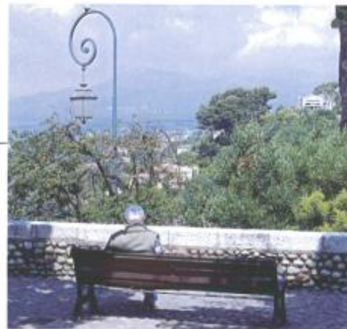
Der er god tid til at nyde udsigten over bjergene på en stille dag i Haut-de-Cagnes.

smalle brostensbelagte gader, der snor sig rundt i byen. Men da jeg spørger en af de lokale, om her så ikke er spækket med turister i højsommeren, lyder svaret: Egentlig ikke. For her er ingen små modebutikker, ingen souvenir-shops.