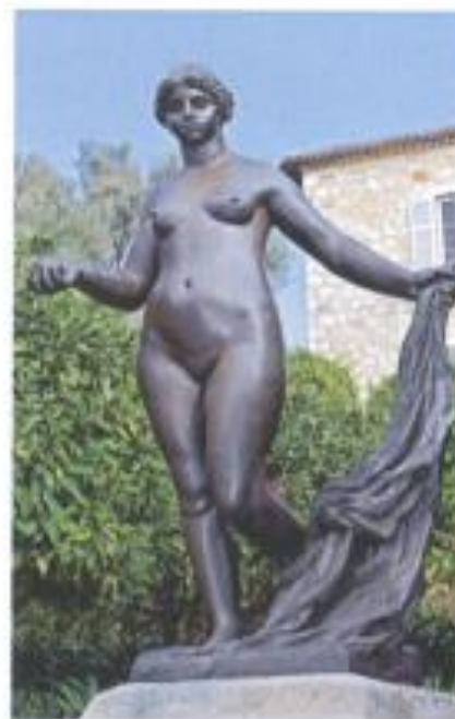
Renoir er også mester for kvindeskulpturen i appelsinlunden foran Musée Renoir.